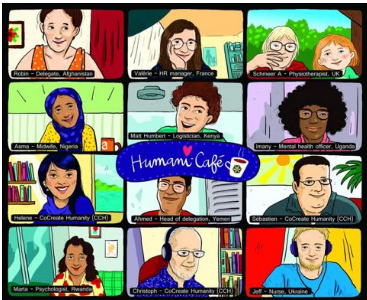
Illustration de Joëlle Dreidemy, illustratrice française de livres pour enfants

La pandémie a été un facteur majeur de l'évolution de l'action de CoCreate Humanity car les réunions virtuelles ont ouvert de nouveaux horizons, et elles ont amené des travailleurs humanitaires du monde entier à se connecter à nous.